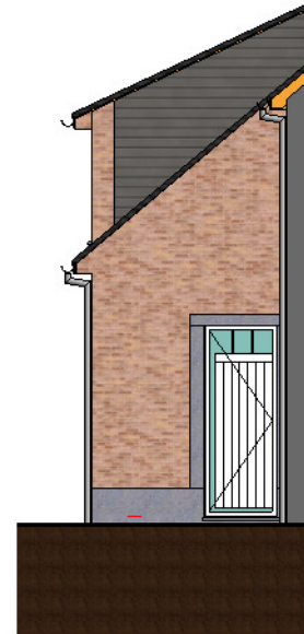
zijgevel lot 135