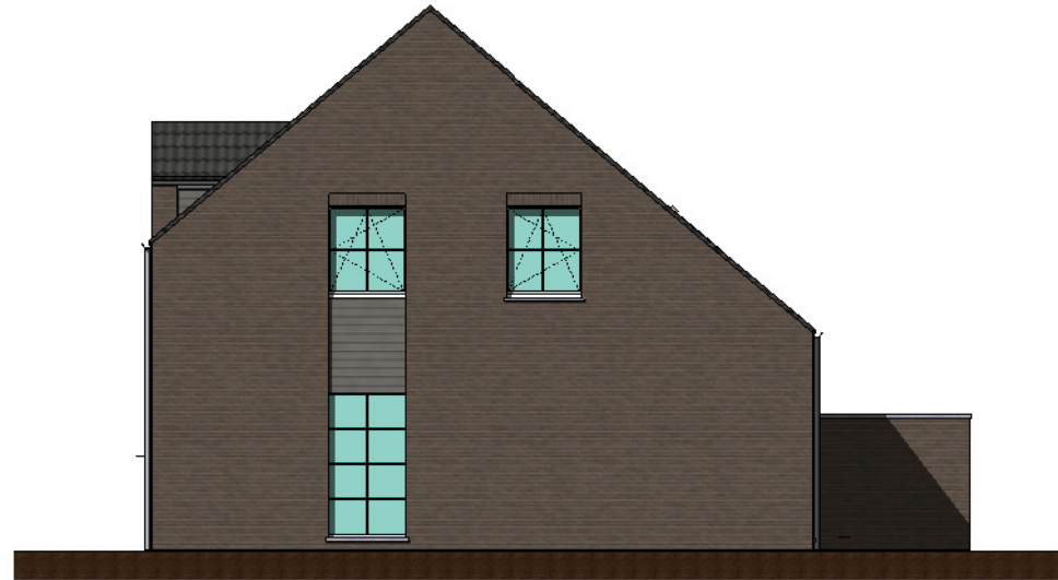
Façade laterale droite