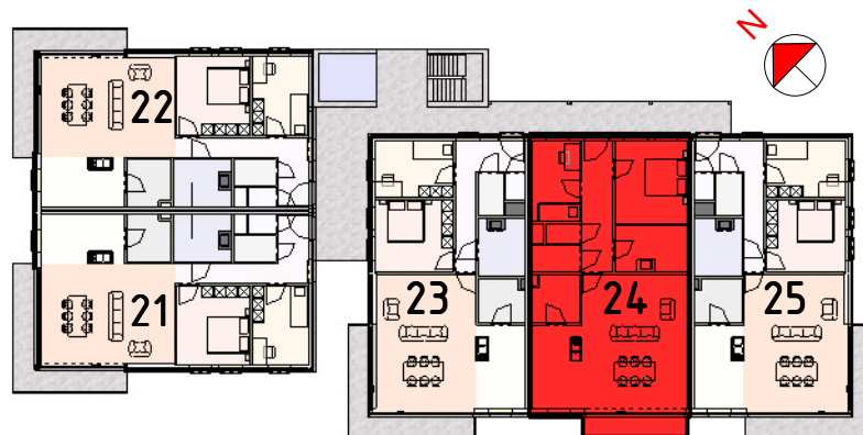
verdieping 2 - situatie A24