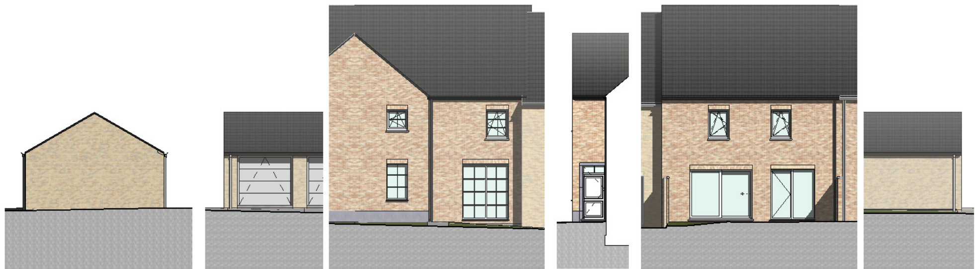
gevel links garage